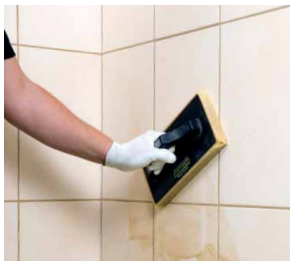
14. Po zaschnutí škárovacej malty obklad dôkladne poumývame čistou vodou a prípadné zbytky škárovacej malty odstránime Murexin Kyselinový čistič Colo SR 30 .