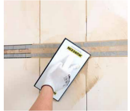
12. Po dostatočnom vytvrdnutí lepiacej malty obklad vyškárujeme. Škárovaciu maltu Murexin FM 60 Premium nanášame vždy pod 45° uhlom na škáry.