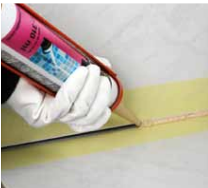
16. Do škár dôkladne natlačíme Murexin Silikónové tesnenie škár SIL 60 .