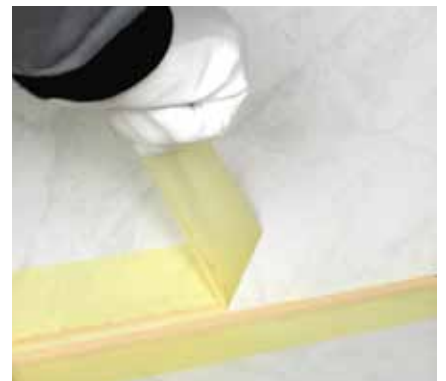
18. Ihneď po zahladení silikónového tesnenia odstránime maskovaciou pásku.