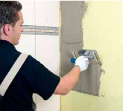
10. Na zaschnutú hydroizoláciu nanesieme zubovým hladidlom Murexin Pružnú lepiacu šedú KGF 65 .