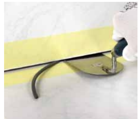
15. Spoje stena-stena a stena-podlaha oblepíme maskovaciou páskou a natlačíme do nich Murexin škárovací povrazec.