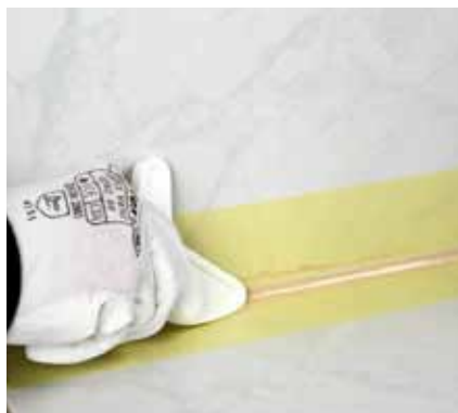
17. Pomocou vhodného nástroja spoj zahladíme a odstránime prebytočný silikón.