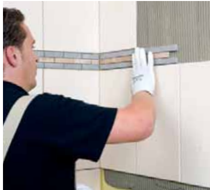
11. Do takto nanesej lepiacej malty postupne nalepíme obklad.