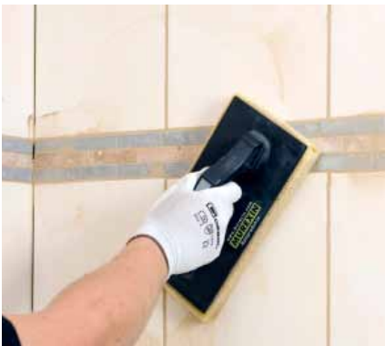
13. Po vyškárovaní a čiastočnom zaschnutí škárovacej malty obklad umyjeme čistou vodou.