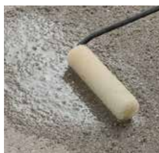
Silanová impregnácia MS-X 1