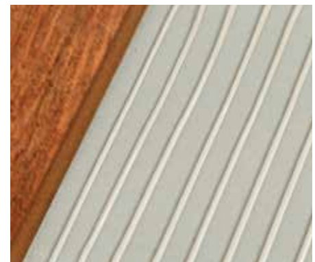
Mechanické nanášanie lepidla vytvára jednotný / rovnomerný lepiaci vzor.