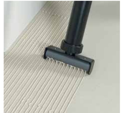
Pri práci spočíva váha aplikátora X-Bond 200 s náplňou na podlahe a lepidlo sa nanáša v rovnomerných huseniach.

Jednoducho čisté parkety, čisté ruky, čistá práca.