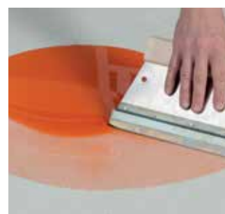
Silanová parozábrana MS-X 3

Silanová impregnácia MS-X 1 je vhodná na spevnenie a sanáciu nestabilných, menej stabilných resp. pieskujúcich minerálnych podkladov, ako sú cementové a anhydritové potery a betón. Vďaka svojej nízkej viskozite má vysokú penetračnú schopnosť a vniká hlboko do pórov podkladu. Jednoducho sa aplikuje valcovaním na podklad. Veľkou výhodou MS-X 1 je rýchle schnutie: môže byť prepracovaná po cca 2 hod., a výrazne tak šetrí čas oproti doteraz bežne používaným 2-komp. epoxidovým impregnačným živiciam! MS-X 1 je 1-zložková a preto sa ľahko a bezpečne aplikuje, bez možnosti spracovateľských chýb. Je založená na silanovej báze a preto je MS-X 1 bez emisií a je fyziologicky nezávadná. Pred následnou aplikáciou nivelačných hmôt a lepiacich mált Murexin naneste na impregnovaný podklad s MS-X 1 špeciálny adhézný mostík DX 9 . Na impregnovaný podklad s MS-X 1 je možné priamo aplikovať iba Murexin MSP a PU lepidlá. Nie je vhodný na prepracovanie s epoxidovými živiciami.