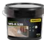
Lepidlo na parkety X-Bond MS-K 539