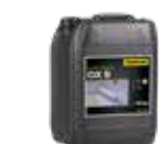
Špeciálny adhézný mostík DX 9

Obe prezentované systémové riešenia predstavujú základný systém pre jednoduchšie vizuálne znázornenie. V praxi je možné vybrané produkty doplniť alebo nahradit inými súvisiacimi produktmi v závislosti od konkrétnej situácie. Uvedené informácie môžu byť predmetom konkrétne spracovaného návrhu a nie sú nevyhnutne prenosné do praxe.