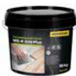
Pružné lepidlo na parkety X-Bond MS-K 509 PLUS